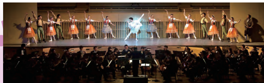
松垣バレエ団 (2011年度のオーケストラ・ディスカバリー公演から)