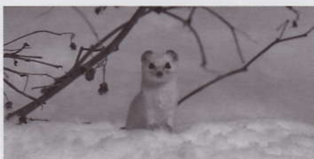
Least Weasel, Finland