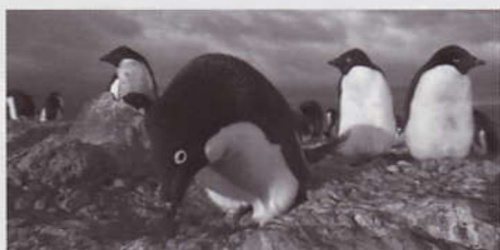
An Adie Penguin Male Building A Stone Nest In Anticipation Of The Females Arrival