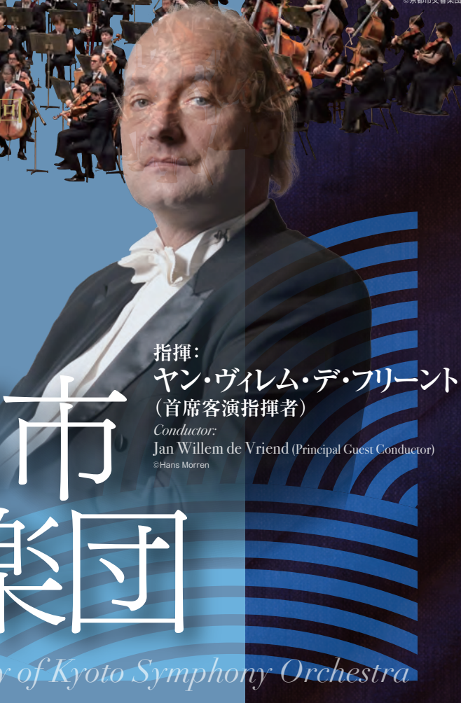
指揮： ヤン・ヴィレム・デ・フリースト (首席客演指揮者) Conductor: Jan Willem de Vriend (Principal Guest Conductor)