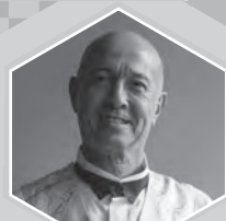
井上道義