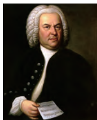
J.S. バッハ (1685 ~ 1750)