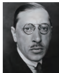
ストラヴィンスキー (1882 ~ 1971)