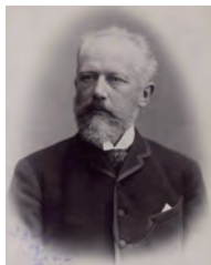
チャイコフスキー (1840 ~ 1893)