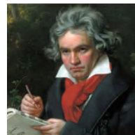
ベートーヴェン (1770 ~ 1827)