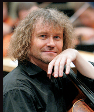
チェロ: アレクサンドル・クニャーゼフ

【プログラム】 ショスタコーヴィチ チェロ協奏曲第1番変ホ長調 Op.107 チェロ協奏曲第2番ト長調 Op.126 交響曲第2番ロ長調 Op.14 「十月革命」