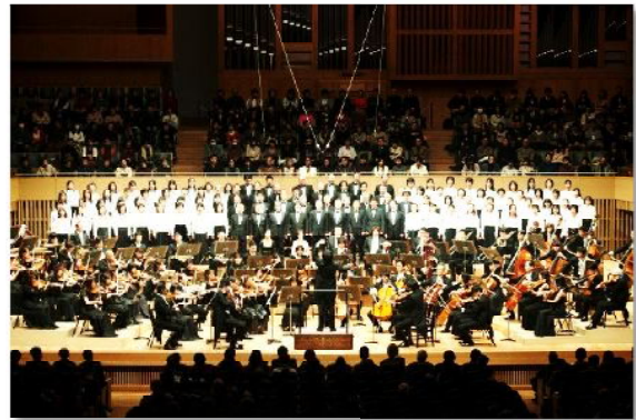
<2012年第九演奏会より>