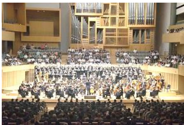
<2015 年定期演奏会より>