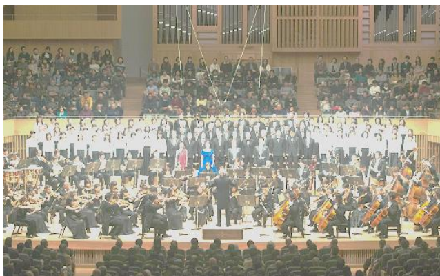
〈2013年第九演奏会より〉